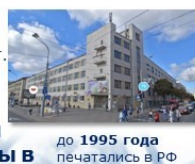
до 1995 года печатались в РФ

в 1995 г. впервые белорусские почтовые марки были отпечатаны в Республике Беларусь